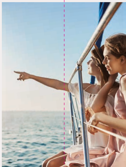
Desporto e Aventura