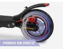
FRENO DE DISCO