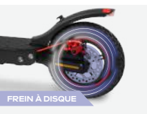
FREIN À DISQUE