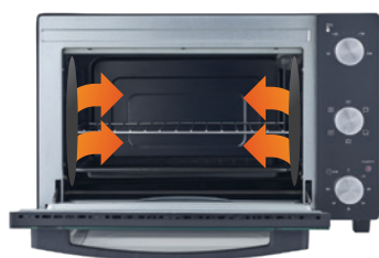
Revestimento Antiaderente Easy Clean

EAN: 5601545015129 | 1 unidade por caixa master