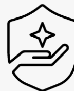
3 anos, recolha e devolução UM917E