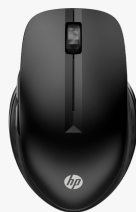
Rato sem fio HP 430 compatível com vários dispositivos 3B4Q2AA