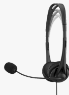
Auscultadores estéreo G2 HP de 3,5 mm 428H6AA